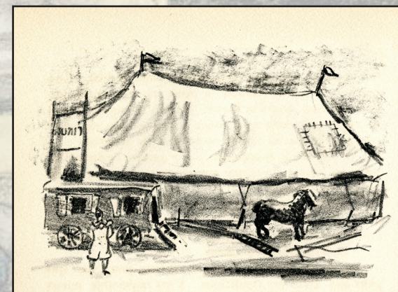
« Scène de cirque » (lithographie) par Edmond Heuzé dans Le Chapeau de mes amours , 1949